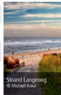
Strand Langeoog