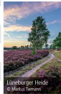
Lüneburger Heide